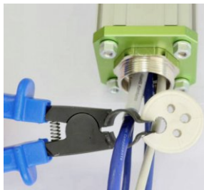
Die Sprezzange hilft beim Einführen von Kabeln in den Dichteinsatz